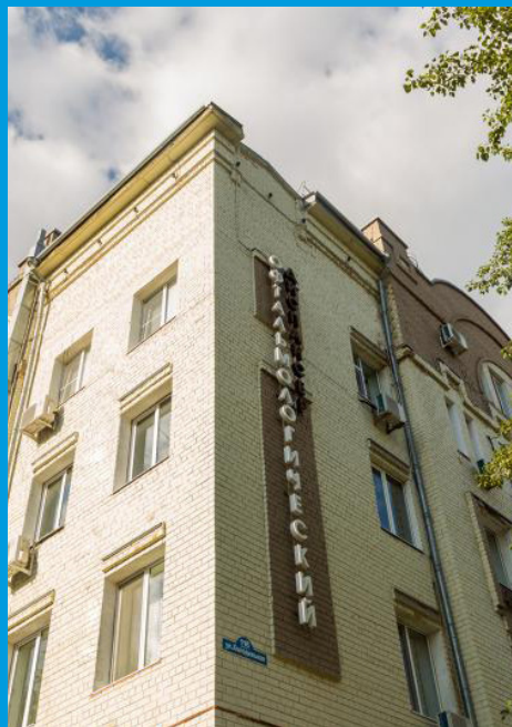
秋明眼科疾病防治所