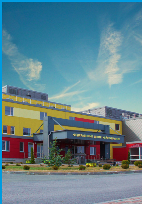
俄罗斯联邦卫生部神经外科中心